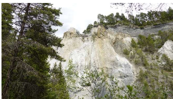
Rheinschlucht / Val Mulin