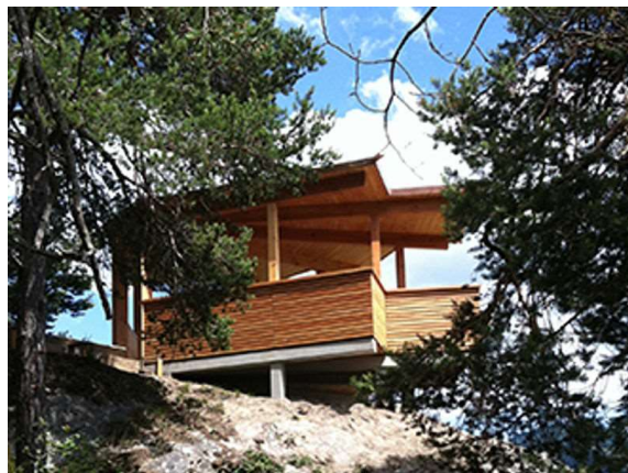
Aussichtsplattform Crap Signina