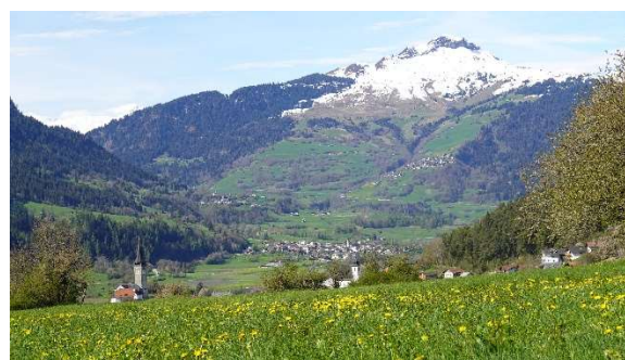
Sagogn mit Sicht auf Piz Mundaun